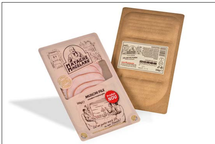
Obr. 3: Papírové balení na nářezy

Rovněž v segmentu hlubokotažného tvarování představí firma SEALPAC zvlášť udržitelné řešení: Návštěvníci veletrhu budou mít možnost živě sledovat, jak „All-in-One – balicí stroj“ SEALPAC PRO14 vyrábí obaly pro plátkované výrobky, jejichž spodní i vrchní fólie je z pa-