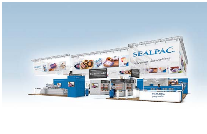
Obr. 4: Stánek firmy Sealpac – IFFA 2019

Firmu SEALPAC a BS GLOBAL můžete navštívit na veletrhu IFFA od 4. do 9. května 2019 ve Frankfurtu, hala 11.0, stánek D11.