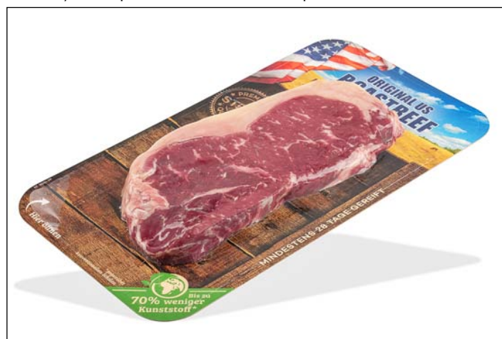
Obr. 2: Balení FlatSkin ® pro čerstvé maso

i v prodejních diskontního typu skutečný boom. Během maximálně krátké doby se tento udržitelný obalový systém vyvinutý firmou SEALPAC stal nejprodávanějším výrobkem a je používán úspěšně již ve více než 10 zemích. SEALPAC FlatSkin ® umožňuje nejen kvalitní nýbrž i vysoce atraktivní balení masných výrobků. Balený výrobek se zafixuje vysoce transparentní bariérovou fólií na plochém běleném nebo nebeleném obnovitelném kartonu z čerstvých vláken, který je kaširovaný polymerovou ochrannou vrstvou. Tato vrstva vytváří spolehlivou bariéru proti tukům, vodě a kyslíku. Vysoce stabilní karton lze na obou stranách opatřit potiskem a poskytuje tak dostatečně velkou plochu pro informace o výrobku a umístění obchodní značky. Takto se nechá balení výborně prezentovat ve vertikální pozici.