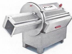
Sect 200 Inteligentní porcování