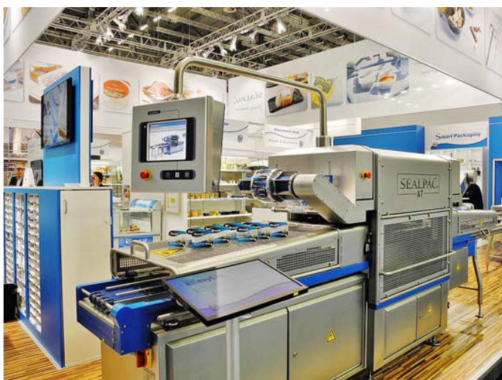
Obr. č. 4: Traysealer A7 k balení systému EasyLid®

Vystavené zařízení bylo modifikováno k aplikaci systému balení EasyLid®. Jedná se o inovativní způsob balení šetrný k životnímu prostředí. Je extrémně účinný, zpracovateli pomáhá uspořít materiál, pro koncového spotřebitele je mimořádně komfortní. Systém začíná s použitím speciálních táček EasyLid®, vyráběných nizozemskou společností Naber Plastics. Tato firma se účastnila na vývoji tohoto systému balení.