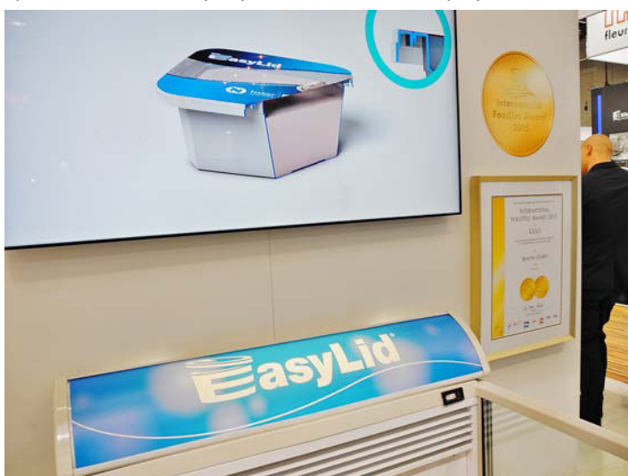
Obr. č. 5: Za systém balení EasyLid® obdržel SEALPAC zlatou medaili

Miska EasyLid® má běžný okraj pro svár s horní folií a také ještě přídatný okraj. Horní folie, která se dá snadno otevřít, je navařená na běžný okraj misky, zatímco přídatný okraj je hermeticky svařený v tom samém kroku. Když se poprvé miska otevře, horní folie automaticky vytvoří víčko a dovoluje opětovné uzavření misky s produktem.