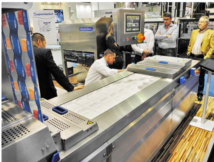
Obr. č. 2: Hlubokotažný balicí stroj SEALPAC RE20 s technologií ThermoSkin® na veletrhu Anuga FoodTec 2015

Hlubokotažné balicí stroje disponují řadou originálních řešení. RapidAir Forming System umožňuje zformovat ze spodní fólie podložní misku, aniž by bylo použito mechanického působení razníku. Vše zajišťuje horký vzduch spolu s působením tlakového vzduchu. Výhodou jsou zesílené rohy balení, zajištění bariérových vlastností a úspora materiálu. Chce-li zákazník baličky se snadným otevíráním, má k dispozici EasyPeelPoint. V oblasti hlubokotažných strojů stojí na vrcholu nabídky řada RE30. Tyto výkonné baličky zvládnou až 15 taktů za minutu, šířka použité fólie je mezi 285–680 mm, délka kroku může být 150–1000 mm. Maximální průtah fólie je 190 mm a délka samotného stroje kolísá podle provedení od 4,5 do 15,0 metru.