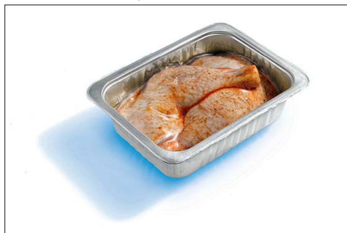
Obr. č. 6: Balení TraySkin® od firmy SEALPAC

V dnešní době je velmi populární vakuové skin balení masa. Dodavatelé technologií nabízejí tento typ pod různými značkami (např. Darfresh®, MultiFresh™). Pozadu nezůstal ani SEALPAC. Pro své zákazníky má k dispozici dva způsoby, označované jako ThermoSkin®, pokud se balení realizuje na hlubokotažných strojích, nebo TraySkin®, dochází-li k realizaci na traysealerech.